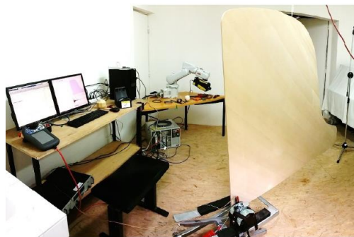
Figure 2. Vue du dispositif expérimental pour la mesure vibratoire de la table de référence SPCP. D'après [9].