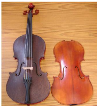
Figure 1. Violon dont la table d'harmonie d'origine en épicea a été remplacée par une structure sandwich balsa/fibre de lin. D'après [1].

Le Laboratoire Navier (Ecole des Ponts ParisTech) et le LVA (INSA-Lyon) sont partenaires du projet ANR 2015-2019 « MAESSTRO » 1 . Ce projet a pour but de fournir un outil numérique pour la CAO de tables d'harmonie de piano, de proposer de nouvelles architectures de tables et des méthodes pour leur optimisation. Dans ce cadre, l'objectif de ce stage de master est de concevoir et fabriquer une table d'harmonie d'un piano ¼ de queue Stephen Paulello (SPCP) 2 en matériaux composites reproduisant le comportement dynamique d'une table en épicea (bande de fréquence [20Hz-5kHz]).